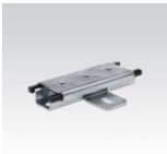
MÜPRO Schiebeschlitten 1,75kN M10 und M12