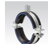
MÜPRO Schraubrohrschele mit Dämmgulast® Einlage blau (flammwidrig), Anschlussgewinde ab M10 3/8" – 170mm