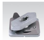
MÜPRO MPC-Schnellbefestiger mit Innengewinde M10