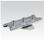
MÜPRO Schiebeschlitten 4,0kN M12, M16 und 1/2"