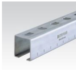
MÜPRO MPC-Systemschienen 38/40, 39/52, 40/60, 40/80 38/48, 38/80, 40/120