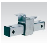
MÜPRO Vierkant Schiebeschlitten M12 und M16