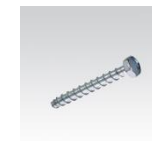
MÜPRO Betonschraube M10