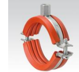
MÜPRO Schraubrohrschele mit Dämmgulast® Einlage rot (hochtemperaturbeständig), Anschlussgewinde ab M10 3/8" – 170mm