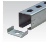
MÜPRO Halteklammern für MPC-Systemschienen und MPC-Schienenkonsolen 38/40, 38/80 (M10), 39/52, 40/60, 40/120 (M10)