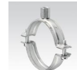
MÜPRO Schraubrohrschele ohne Einlage, Anschlussgewinde ab M10 3/8" – 170mm