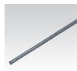
MÜPRO Gewindestangen M8, M10 und M12