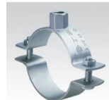
MÜPRO Schraubrohrschele schwere Ausführung, ohne Einlage, Anschlussgewinden ab M12 3/8" - 6"