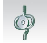
MÜPRO Schiebebügel M10