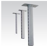
MÜPRO MPC-Schienenkonsolen 38/40, 40/60 38/80 (Konsolenlänge, 700mm)