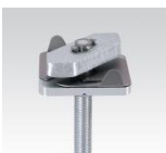
MÜPRO MPC-Schnellbefestiger mit Aussengewinde M10