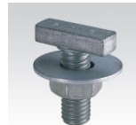
MÜPRO Hammerkopf-Schrauben M10 und M12