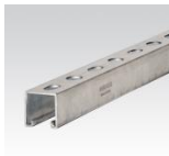
MÜPRO MPR-Systemschienen 41/21/2,0 , 41/31/2,0 , 41/41/2,0 41/41/2,5 , 41/62/2,5 , 41/42/2,0, 41/82/2,0 , 41/124/2,5