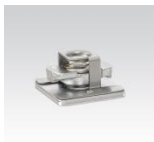
MÜPRO MPR-Schnellbefestiger M10 M12