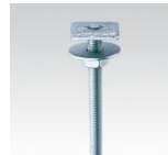
MÜPRO Hammerkopfbefestiger M10 und M12