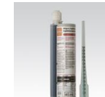
MÜPRO Injektionsanker XV Plus M8, M10, M12