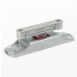
MÜPRO Phonolyt dB 27 und dB 40