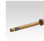
MÜPRO Steckanker M8, M10, M12, M16