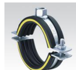
MÜPRO Schraubrohrschele schwere Ausführung, mit Dämmgulast® Einlage gelb, Anschlussgewinde ab M12 3/8" - 6"