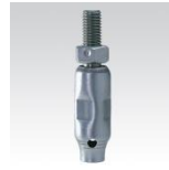
MÜPRO Pendelaufhänger lang und kurz M10 und M12