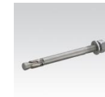
MÜPRO Hochleistungsanker BZ M8, M10, M12, M16