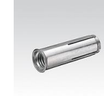
MÜPRO Stahldübel mit Bund M8, M10, M12