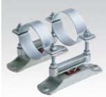
MÜPRO Phonolyt Doppelbausatz dB 40 2" - 6"