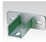
MÜPRO Sattelflansch für MPC-Systemschienen 38/40, 39/52, 40/60, 40/80 (M10)