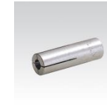
MÜPRO Stahldübel M8, M10, M12, M16