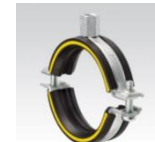
MÜPRO Schraubrohrschele mit Dämmgulast® Einlage gelb, Anschlussgewinde ab M10 3/8" – 170mm