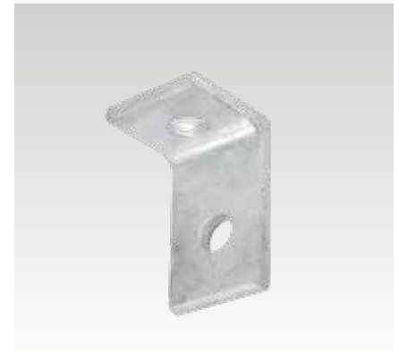
Größe 1, 2