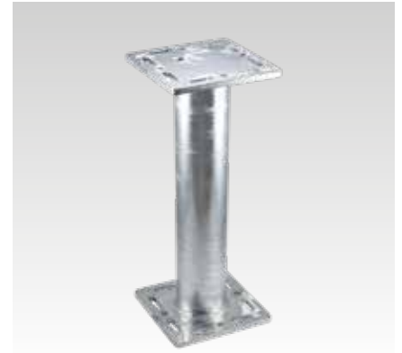
MPT 240x240 + 240x240, D 114,3