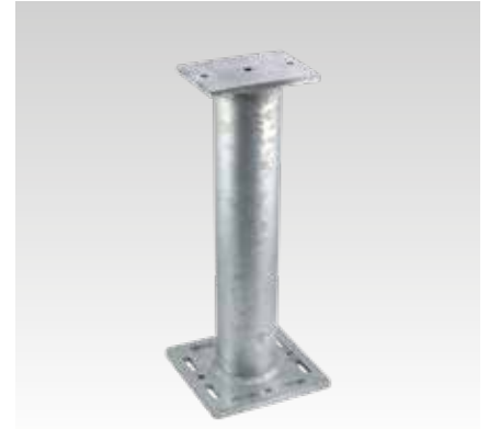
MPT 240x240 + 200x140, D 114,3