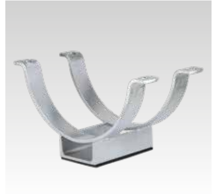
UPG-2 und ISO-Schellen Typ 170 EX - separat zu bestellen