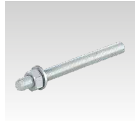
Ankerstange für Voll- und Lochstein Typ VMU-A, Festigkeitsklasse 5.8