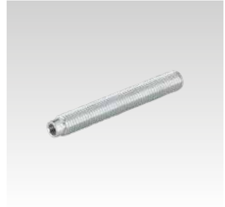
Ankerstange für Voll- und Lochstein Typ VMU-IG, Festigkeitsklasse 5.8