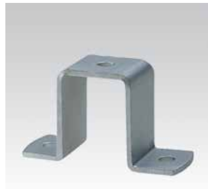
Für Profil 38/40, 38/48, 39/52, 40/60, 40/80, 38/80 und 40/120