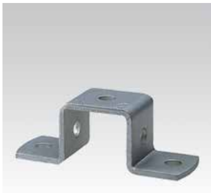
Für Profil 28/30